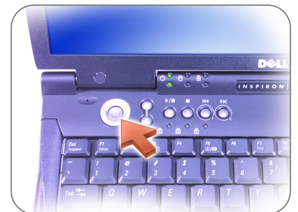
Power Button 電源ボタン 电源按钮 電源按鈕