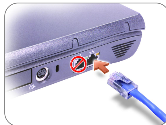
Network Option ネットワークオプション 网络选件 網路選用元件