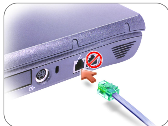
2 Modem Option モデムオプション 调制解调器选件 數據機選用元件